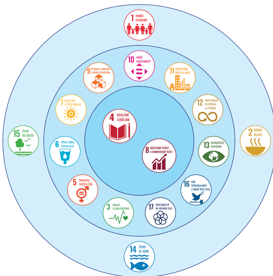
Obr. 4: Hierarchie cílů

Lze shrnout, že všechna podstatná hlediska přináší určitý vzorec, kdy existují dva nejvýznamnější cíle SDG 4 Kvalitní vzdělání a SDG 8 Důstojná práce a ekonomický růst. Následuje skupina cílů, které mají střední význam a skupina cílů s nejnižší frekvencí výskytu a nízkým hodnocením. Tato hierarchie cílů je vizuálně uvedena na Obr. 4.