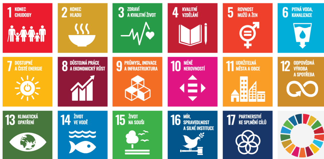
Obr. 1: Cíle udržitelného rozvoje