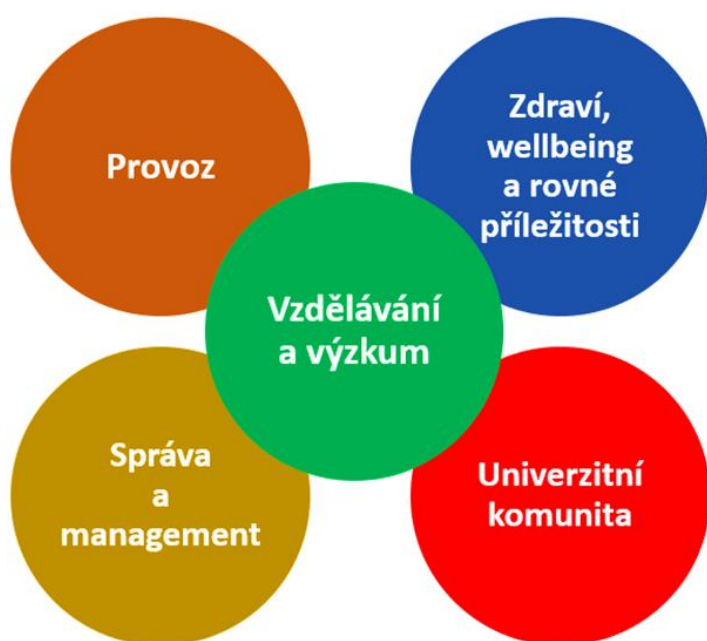
Obr. 5: Identifikované hlavní strategické oblasti

S přihlédnutím k výsledkům stakeholder dialogu a stanovené vizi je tento dokument strukturován do pěti základních strategických oblastí: vzdělávání a výzkum, provoz, zdraví a well-being, správa a management, a univerzitní komunita.